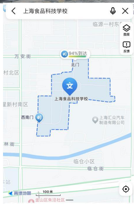
上海食品科技学校 培训机构 9分钟前有人想去 1.4公里 金山区朱泾镇万安街395号